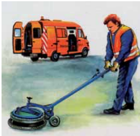
Abbildung 1: Schachtdeckelhebergerät

In Rohrleitungen mit geringen Querschnittsabmessungen kann die physische Belastung der Versicherten durch den Einsatz ferngesteuerter Roboter – beispielsweise zum Herstellen von Hausanschlüssen oder zur Behebung lokaler Schäden – vermieden werden.