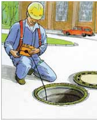
Abbildung 4: Überprüfen der Schachtatmosphäre

5.4.2.5 Der Unternehmer darf mit dem Freimessen nur Mitarbeiter beauftragen, die über die erforderliche Sachkunde verfügen.