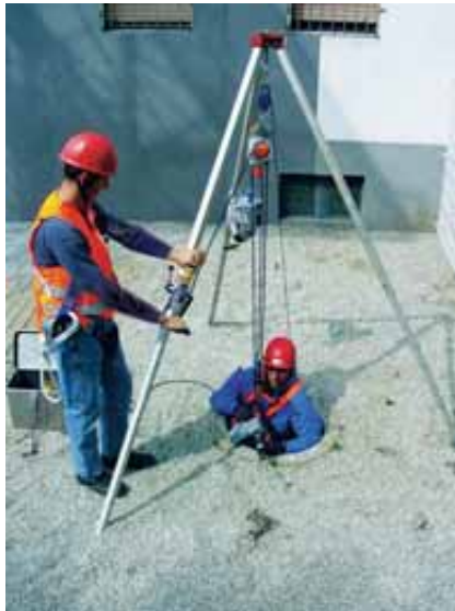
Abbildung 5: Rettungshubgerät