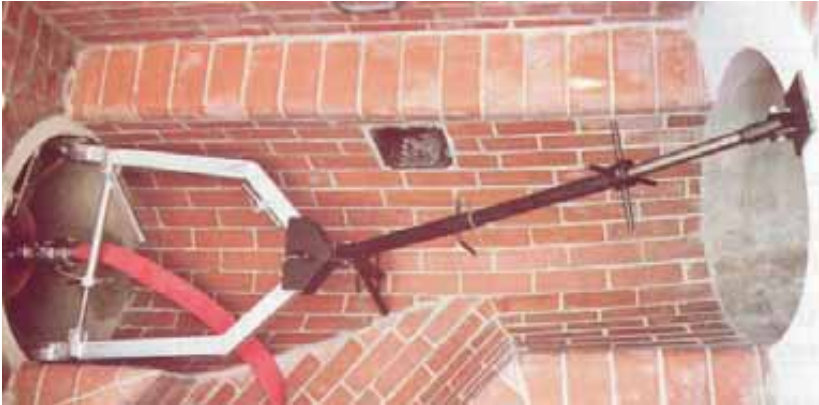
Abbildung 6: Absperrelement mit Ausschubsicherung