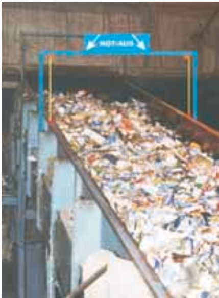
Bild 6: Sofern nicht sichergestellt ist, dass alle Personen, die sich im Pressenbereich aufhalten, mit Transpondern ausgerüstet sind, werden zusätzlich Reißleinen über den Seitenwangen des Zuführförderers angeordnet.