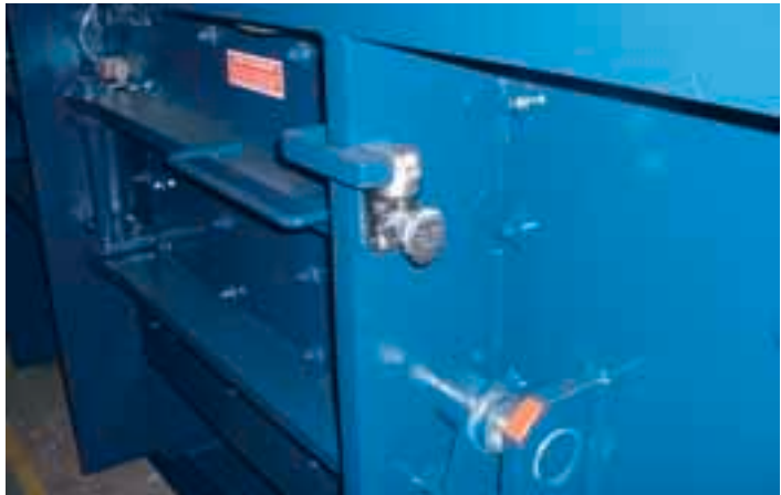
Bild 1: Zugangstür über Schloss gesichert; passender Schlüssel befindet sich im Schaltschrank, das Abziehen des Schlüssels vom Schaltschrank bewirkt die Trennung vom Netz

Zugänge zur Presse (in die vollständig eingestiegen werden kann) lassen sich nur bei vom Netz getrennter Ballenpresse öffnen (sichergestellt z. B. durch ein Schlüsselabhängigkeitssystem).