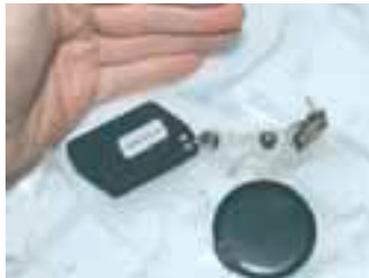
Bild 4: Verschiedene Transponder

me schalten Zuführförderer und Presse ab, wenn Personen in den Bereich des Pressenschachtes gelangen. Die zu schützenden Personen müssen einen Personenerkennungs-Baustein (Transponder) tragen. Gerät dieser Baustein in das Überwachungsfeld der im Bereich des Pressenschachtes angebrachten Antenne, so wird der Abschaltvorgang von Presse und Zuführförderer eingeleitet.