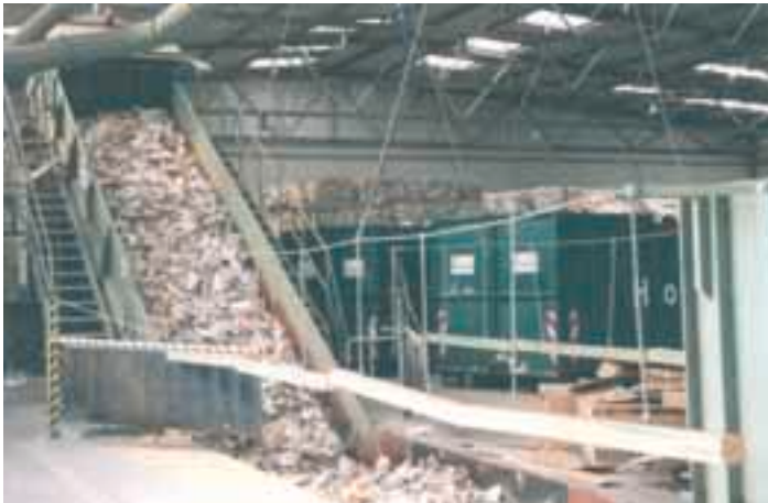
Bild 8: Absicherung der Grube durch hängende Geländer; Treppen zu beiden Seiten des Zuführbandes