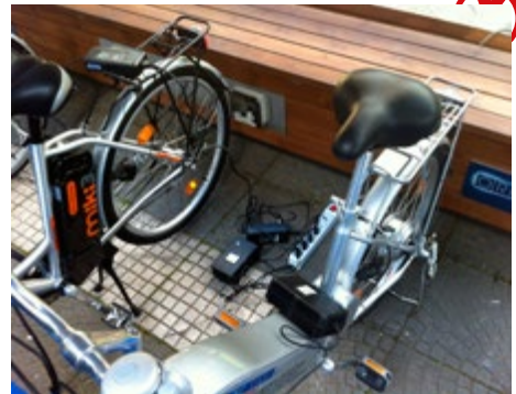
Abb. 18 Nicht empfehlenswert; Ladegeräte liegen auf dem Boden und sind über eine Mehrfachsteckdose unterverteilt (marktübliche Ladegeräte sind nur für die Benutzung in „trocknen Räumen“ geeignet)