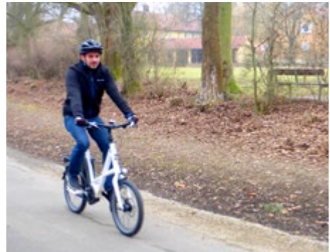
Abb. 16 Auf dem Weg zur Arbeit