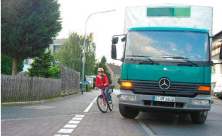
Abb. 16 Gefahr durch „Toten Winkel“