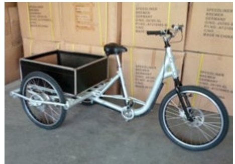
Abb. 1 Einsatz – und Nutzungsmöglichkeiten des Pedelecs 25