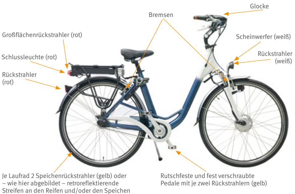
Abb. 7 Vorgeschriebene Ausrüstung des Pedelec 25

Pedelecs 25 müssen mit einem Scheinwerfer und mit einer Schlussleuchte ausgestattet sein. Sie können mit Strom aus einer