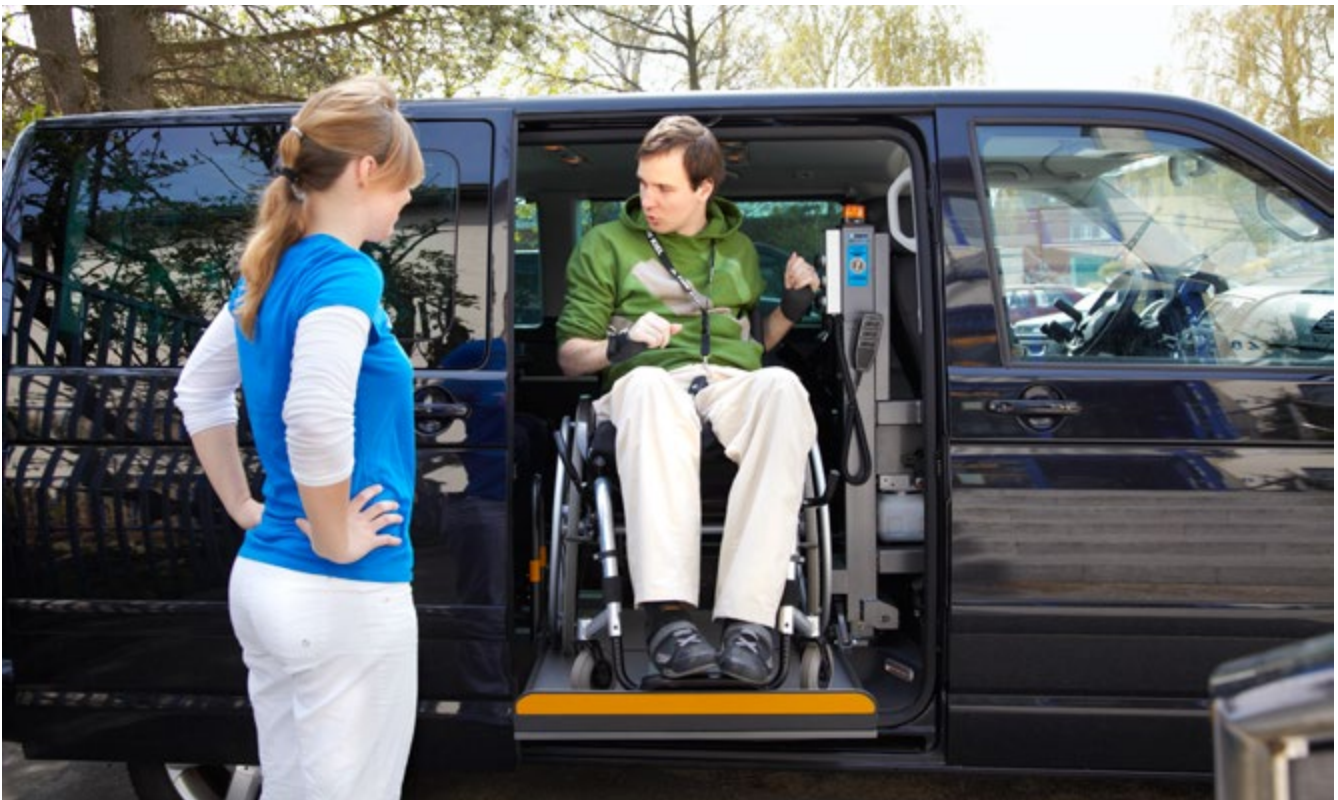
Abb. 7 Fahrzeugeigene Hebebühne für Rollstuhlfahrer

Die Übertragung von Aufgaben sollte schriftlich erfolgen. Dabei muss klar und deutlich hervorgehen, welche Aufgaben in welchem Arbeitsbereich wie erledigt werden sollen. Jede/jeder Beschäftigte, muss konkret wissen, was zu tun ist. So kann beispielsweise dort stehen, dass auf Station X Menschen grundsätzlich mit Hilfe eines Lifters oder eines Rutschbrettes transferiert werden. Dies ist auch in der Pflegeplanung beispielsweise in Form eines Bewegungsplans zu dokumentieren. Auch Ausnahmen hiervon müssen begründet in die Pflegeplanung des einzelnen Menschen aufgenommen werden.