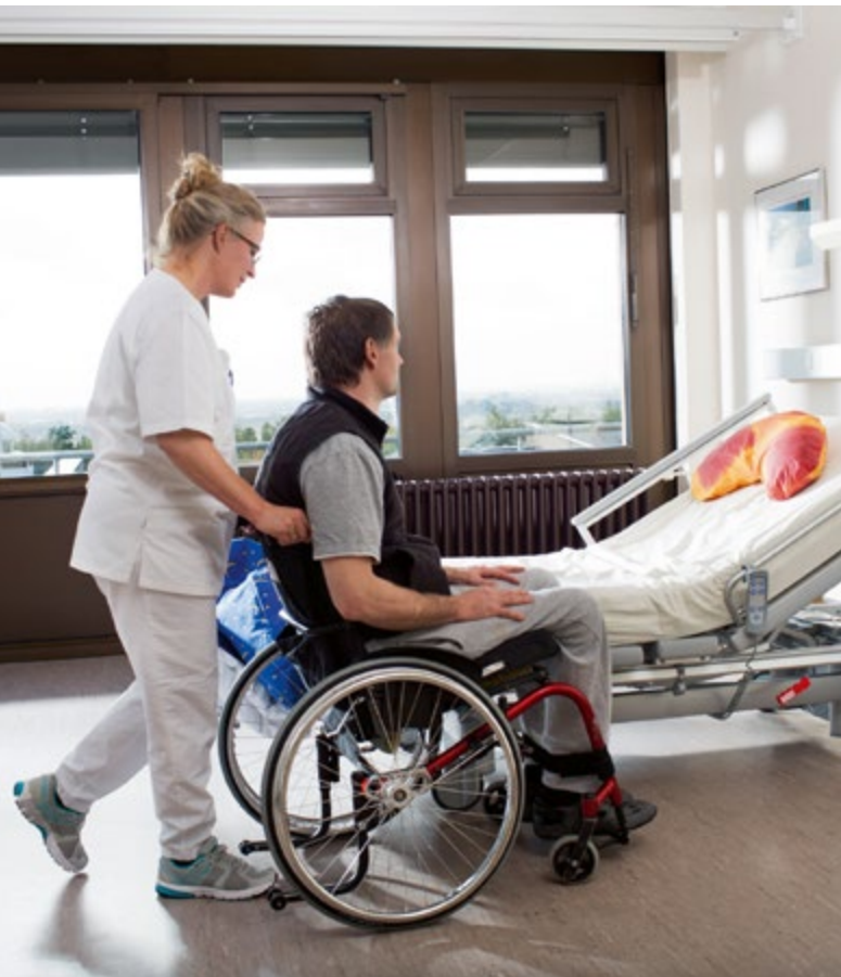
Abb. 2 Bewegungsfreiraum durch die geeignete Größe und Einrichtung des Pflegezimmers