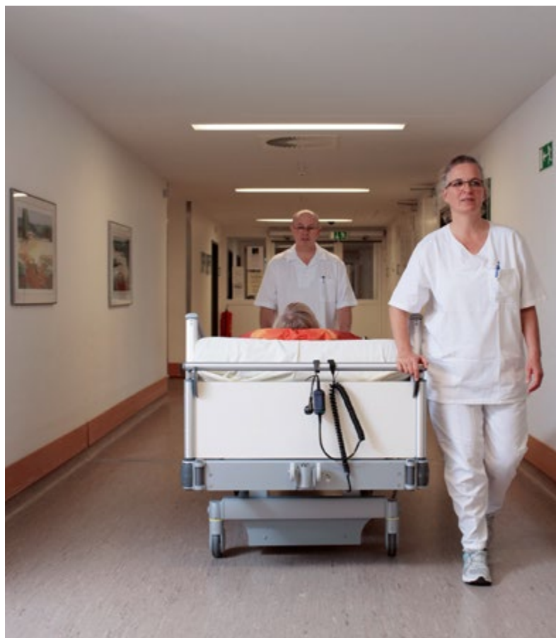
Abb. 6 Ergonomisches und sicheres Schieben eines Pflegebettes mit zwei Pflegekräften