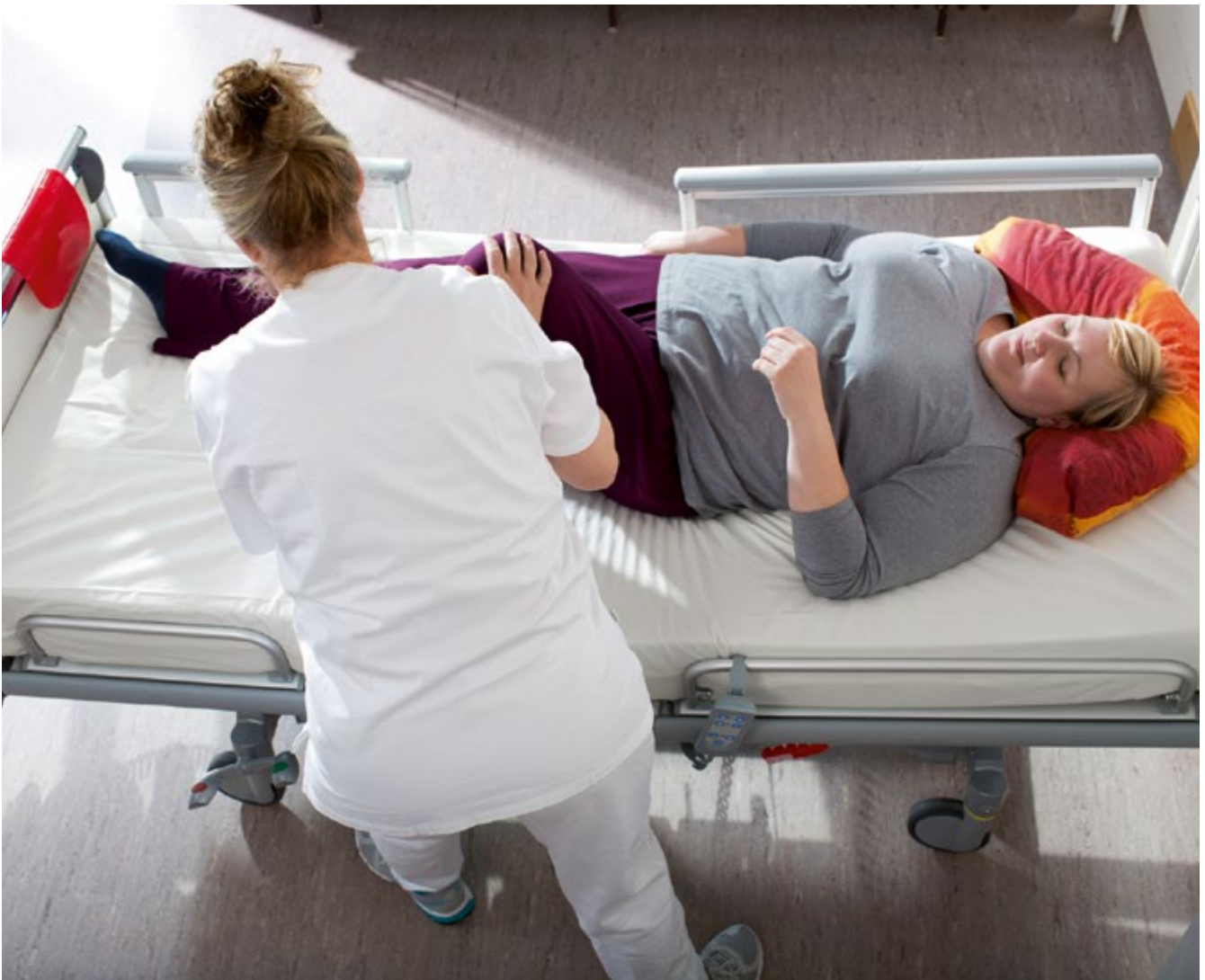
Abb. 1 Bewegungsunterstützung einer Patientin im Bett