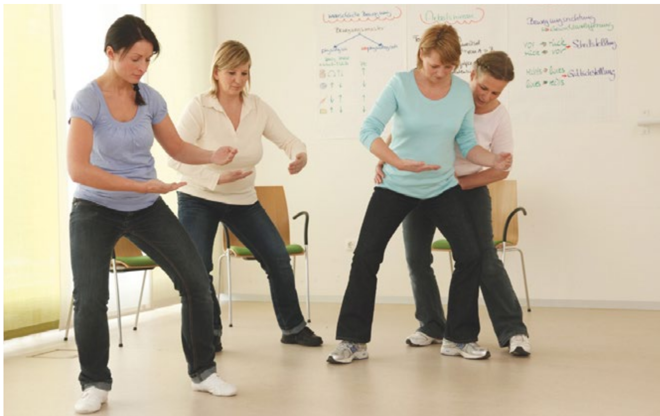
Abb. 10 Unterweisung in der ergonomischen Arbeitsweise: Ausgangsstellung und Körperhaltung

Bei Arbeitnehmerüberlassung liegt die Pflicht zur arbeitsplatz- und aufgabenbereichsbezogenen Unterweisung beim Entleiher (§12 ArbSchG, Abs. 2). Einrichtungen, die mit Arbeitnehmerüberlassung arbeiten, können somit von einer grundsätzlichen