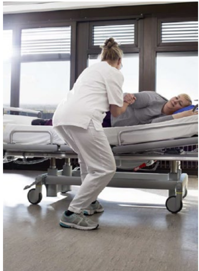
Abb. 9 Bewegungsunterstützung der Patientin: Verbindung von ergonomischer und ressourcenorientierter Arbeitsweise

Darüber hinaus sind fachkundige Beschäftigte in der Lage, mit Hilfe einer systematischen Funktionsanalyse die Möglichkeiten der Eigenbewegung des Menschen zu beschreiben und zu dokumentieren. In eine solche Dokumentation sind dann auch Hinweise zu notwendigen Unterstützungsmöglichkeiten (z. B. selbstständiges Aufrichten im Bett mit Hilfe eines Bettzügels möglich) aufzunehmen oder Hinweise dazu, wie der jeweilige Mensch zu dieser Eigenbewegung durch Bewegungsreize motiviert werden kann.