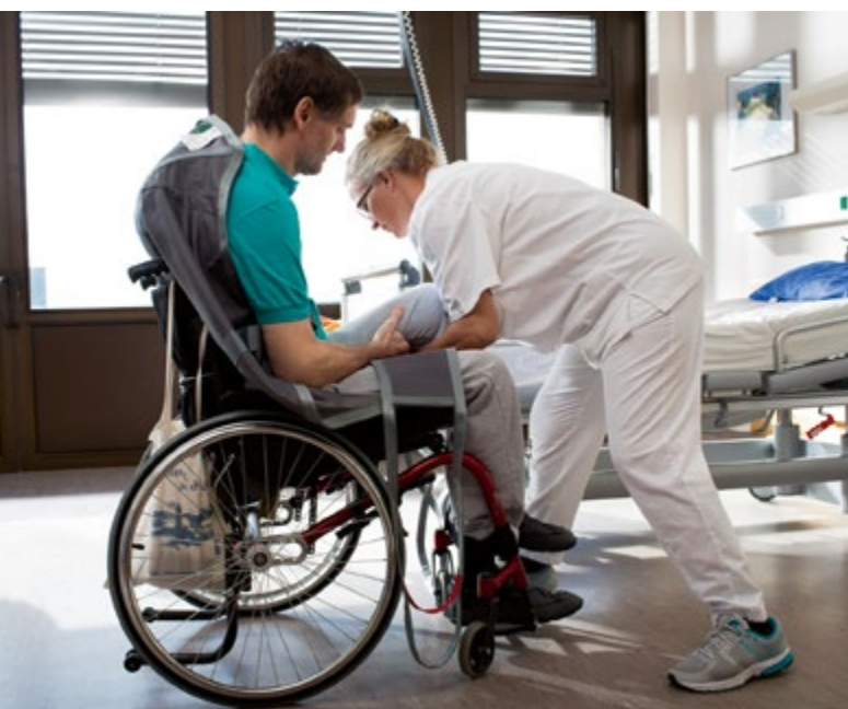
Abb. 3 Anlegen eines Liffertuchs im Rollstuhl für das Deckenschienensystem

Erforderlich ist die Bereitstellung von Hilfsmitteln für alle Situationen, in denen die Gefährdungen durch diese vermieden/minimiert werden können und der Hilfsmiteinsatz praktikabel ist. Vor allem sind dies Technische und Kleine Hilfsmittel zur Bewegungsunterstützung und Hilfsmittel zur Positionsunterstützung: