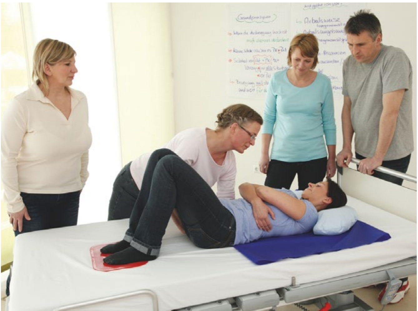
Abb. 8 Unterweisung in der ergonomischen Arbeitsweise: Bewegen einer Patientin im Bett mit Hilfe einer Gleitmatte und einer Antirutschmatte