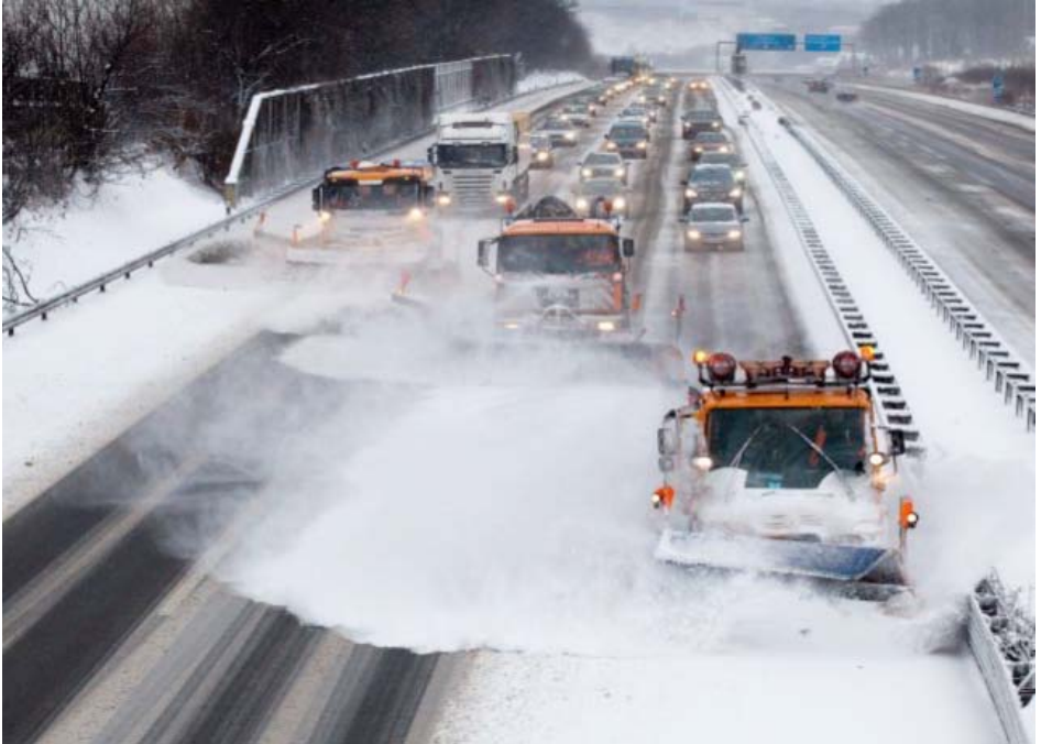
Abb. 5 Winterdienst auf der Autobahn im fließenden Verkehr