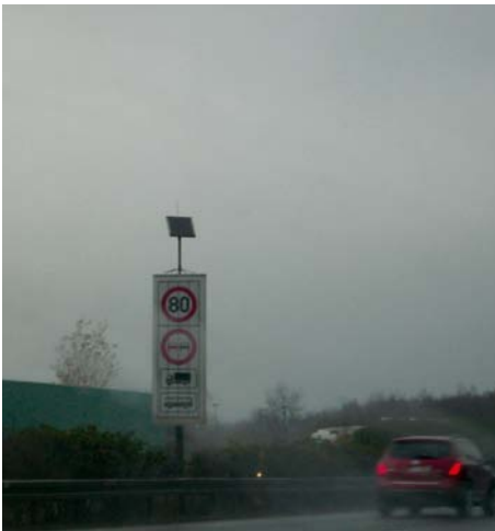
Abb. 11 Aufklappen von Schildern für eine Verkehrskontrolle mittels Fernbedienung aus einem Kontrollfahrzeug

Die Beschilderung der Anhalteplätze für die Straßenkontrollen werden zum Teil noch manuell bedient. Folglich müssen die Beschäftigten sehr gefährliche Fahrbahnüberquerungen durchführen als auch ungeschützt am fließenden Verkehr arbeiten. Hinzu kommt, dass Aufstiege zum Bedienen der Schilder zum Teil ungeeignet oder in einem schlechten Zustand sind.