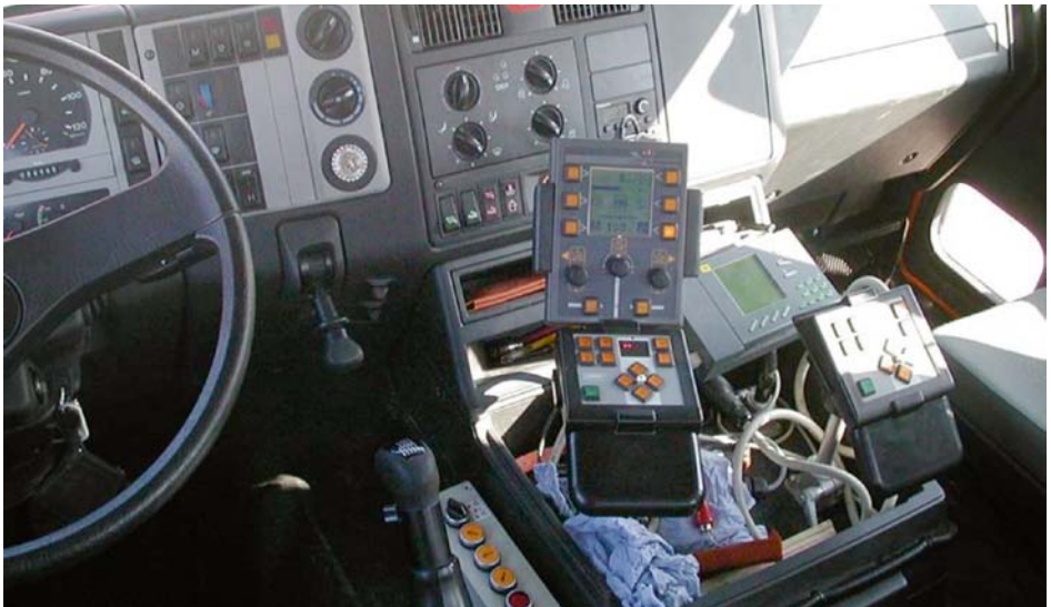
Abb. 10 Fahrerarbeitsplatz beim Winterdienst

Für Beschäftigte die bei Winterdiensteinsätzen unsicher sind, z. B. auf Grund mangelnder Erfahrung, sollte ein zweiter Beschäftigter dabei sein.