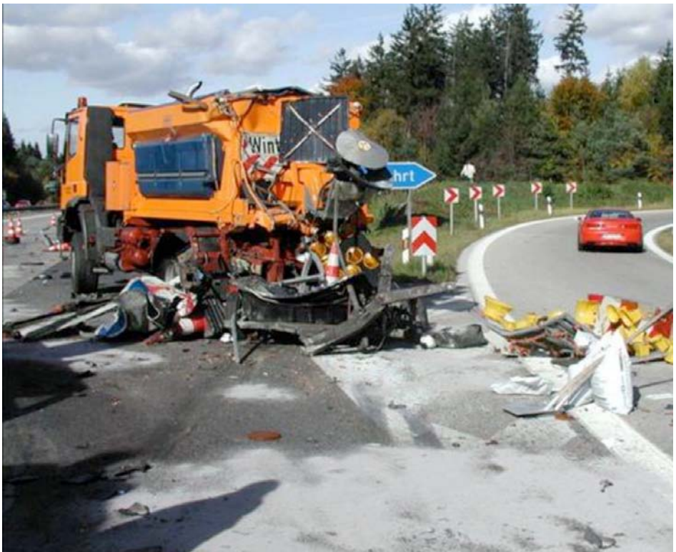
Abb. 7 Sicherungsfahrzeug nach LKW-Aufprall

Jedoch klingen die Beschwerden wiederum in aller Regel nach wenigen Tagen ab. Nur in wenigen Fällen klingen die Beschwerden nicht ab, sondern haben eine psychische Erkrankung zur Folge (z. B. Angststörung, Schmerzstörung, Suchterkrankung oder die Posttraumatische Belastungsstörung).