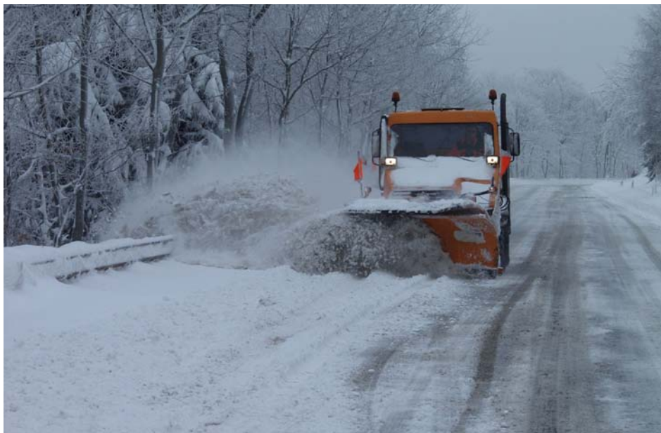
Abb. 6 Alleinarbeit im Winterdienst