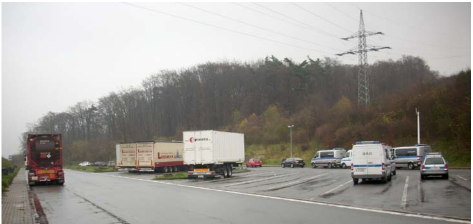
Abb. 12 Optimale Anordnung der Kontrollfahrzeuge mit ausreichend Platz, z. B. für weitere Behörden (Zoll)