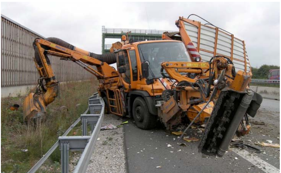
Abb. 1 Mähzug nach LKW-Auffahrunfall

die Beschäftigten mit ihrer Arbeit verbundenen Gefährdung zu ermitteln, welche Maßnahmen des Arbeitsschutzes erforderlich sind“ (§ 5 ArbSchG). Unter Maßnahmen des Arbeitsschutzes sind auch solche zur Verhütung von arbeitsbedingten Gesundheitsgefahren einschließlich Maßnahmen der menschengerechten Gestaltung der Arbeit zu verstehen. Entsprechende Maßnahmen sind mit dem Ziel zu planen, „Technik, Arbeitsorganisation, sonstige Arbeitsbedingungen, soziale Beziehungen und den Einfluss der Umwelt sachgerecht zu verknüpfen“ (§ 4 ArbSchG). Daraus lässt sich die Notwendigkeit einer Beurteilung der Gefährdung durch psychische Belastungen ableiten.