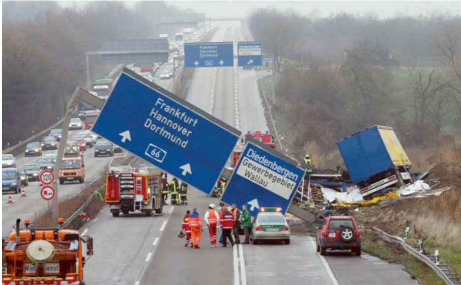
Abb. 8 Eingestürzte Schilderbrücke nach LKW-Aufprall

oder persönlich ungeeigneten Auftragnehmer ausgewählt zu haben. Die Zuverlässigkeit hinsichtlich der Sicherheit ist durch Stichproben genauso zu prüfen wie die Qualität der Auftragsausführung. Auch hier wird der Auftraggeber durch eine vertragliche Regelung entlastet.