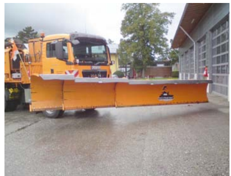
Abb. 9 Winterdienstfahrzeug mit doppelteleskopierbarem Vorbaupflug

Gut funktionierendes Winterdienstgerät bedeutet beim Einsatz weniger Stress und Belastung. Deshalb ist dessen gute Wartung vor und während des Winters sowie eine ordnungsgemäße Prüfung wichtig. Der Einsatz von optimierten Winterdienstgeräten (z. B. Schneepflüge ohne Scherbolzen) und die ordnungsgemäße Kennzeichnung des Fahrzeugs sind vorteilhaft.