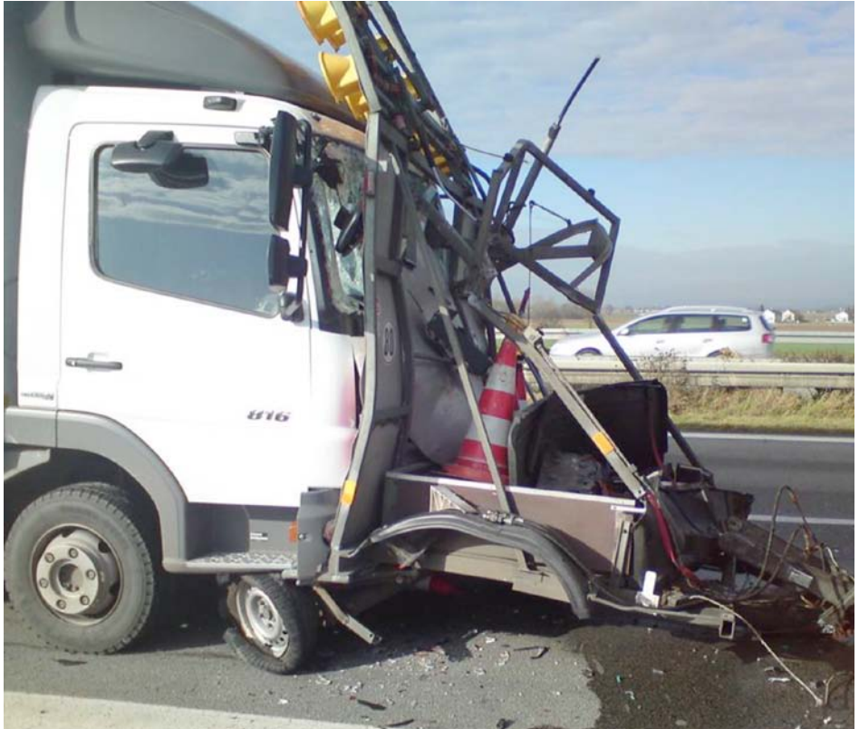
Abb. 4 LKW rammt Warnleitanhänger