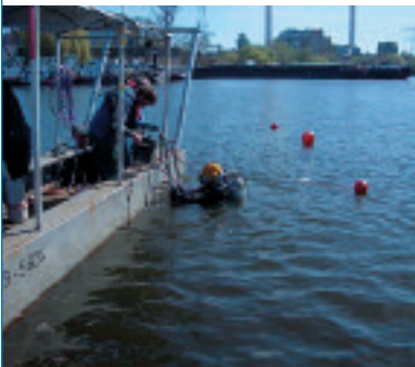
Abb. 8 Einsatz von Kampfmitteltauchern

Die Unterwassersondierung erfolgt mit magnetischen, elektromagnetischen, akustischen oder seismischen Verfahren. Die Sonden sind dabei soweit an den Gewässergrund heranzuführen, dass das gewünschte Leistungsziel erreicht