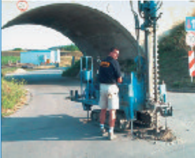
Abb. 7 Bohrlochsondierung

Bei der Gefährdungsbeurteilung für die Tiefensondierung sind zwei wesentliche Faktoren zu beachten: