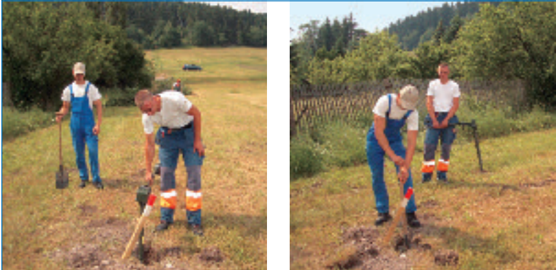
Abb. 5/6: Sondieren und Freilegen