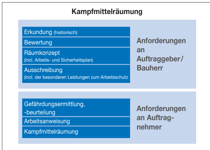
Abb. 3: Aufgabenteilung zwischen Auftraggeber und Auftragnehmer in Bezug auf den Arbeitsschutz

Bei Arbeiten der Kampfmittelräumung ist das Räumkonzept eine unverzichtbare Grundlage für die Ausführungsplanung und Leistungsbeschreibung. Die einzelnen Planungsschritte zur Erstellung des Räumkonzeptes sind in den „Arbeitshilfen Kampfmittelräumung“ des Bundes [1] sehr detailliert beschrieben. Deshalb wird innerhalb dieser BG-Information darauf Bezug genommen. Bestandteil des Räumkonzeptes ist auch der sogenannte „Arbeits- und Sicherheitsplan“ (zu Gliederung und Inhalten siehe Anhang 4 ). Mit Hilfe des Arbeits- und Sicherheitsplans kann der Bauherr/Auftraggeber seine Informationspflichten (siehe Anhang 1 ) erfüllen, indem er damit alle die Informationen bereitstellt, die die ausführenden Unternehmen zur Erfüllung ihrer Pflichten und insbesondere zur Erstellung der Gefährdungsbeurteilung benötigen (siehe Abschnitte 3.2. und 4 ).