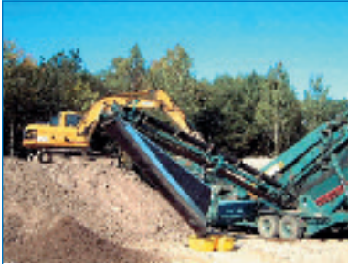
Abb. 15: Einsatz von Separieranlagen

Die Separieranlage ist durch eine entsprechende Schaltung stillzusetzen, wenn der Anlagenführer den gesicherten Arbeitsplatz verlässt.