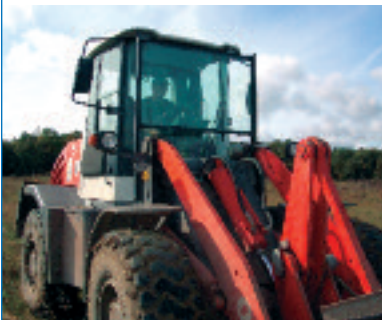
Abb. 12: Bagger mit Sicherheitsverglasung